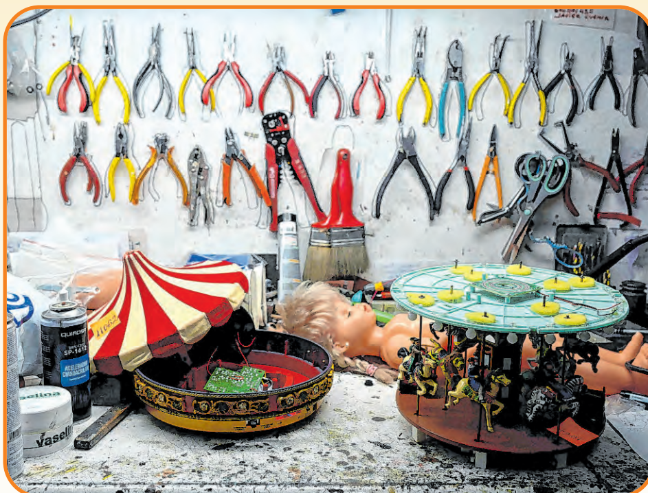
Bonecas, jogos de tabuleiro, bichos de pelúcia e cavalos de madeira povoaram a oficina, agora desativada