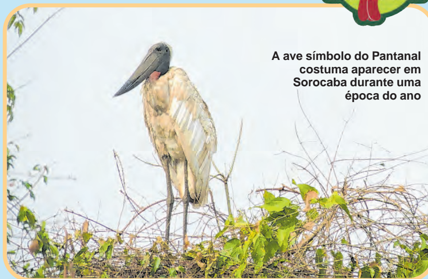
A ave símbolo do Pantanal costuma aparecer em Sorocaba durante uma época do ano

Os ninhos do tuiuiú são enormes, sendo consideradas as maiores estruturas construídas por aves no Pantanal, e podem ser feitos em colônias, com a participação de outras espécies de aves.