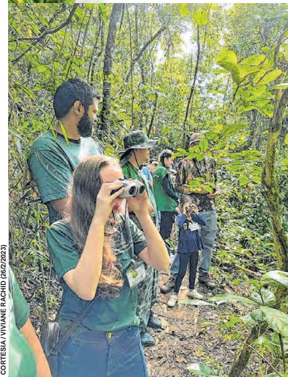
Garotada passou a manhã de domingo em uma trilha rodeada por árvores