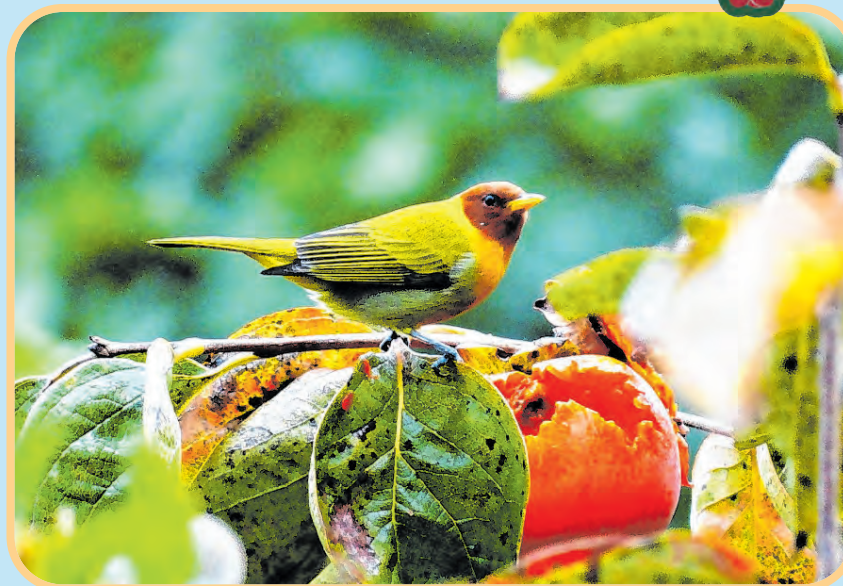
Ela alimenta-se de insetos e pequenos frutos, como o caqui

Assim como a maioria das espécies que se alimenta de frutos,