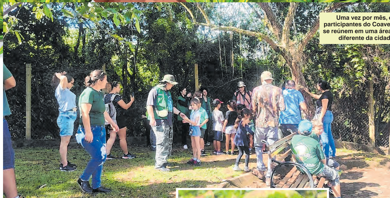
Uma vez por mês, os participantes do Coaves Kids se reúnem em uma área verde diferente da cidade

Para fazer parte do clube infantil, basta acompanhar as redes sociais oficiais da Prefeitura de Sorocaba e ficar por dentro do calendário. A inscrição é realizada no dia do passeio. Podem participar crianças a partir de 6 anos e os pais ou responsáveis podem acompanhar as atividades.