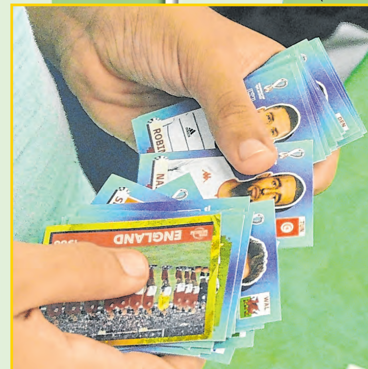
São 670 figurinhas diferentes até completar o álbum

O álbum com capa dura sai por R$ 44,90, enquanto o de papel cartão custa R$ 12. O pacote com cinco figurinhas custa R$ 4. De acordo com a fabricante, a coleção com as 32 seleções do mundial no Catar tem 670 figurinhas, sendo 50 especiais e 80 raras. O kit com 80 pacotes de figurinhas disponível no site está sendo vendido por R$ 320, o que equivale a R$ 4 por pacote. Dessa forma, para completar as 670 figurinhas, serão necessários ao menos R$ 536 para comprar os 134 pacotinhos necessários a essa quantidade de cromos -- considerando que não haja nenhum repetido, o que é muito improvável. Tá vendo porque é tão importante o hábito da troca das figurinhas? (T. M.)