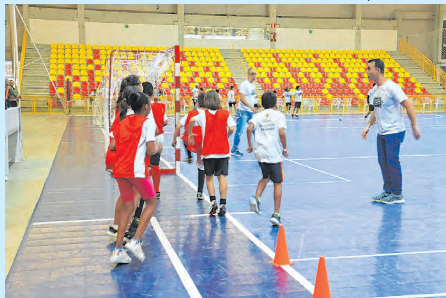
Cerca de 400 crianças e adolescentes participaram de festival esportivo na última segunda-feira