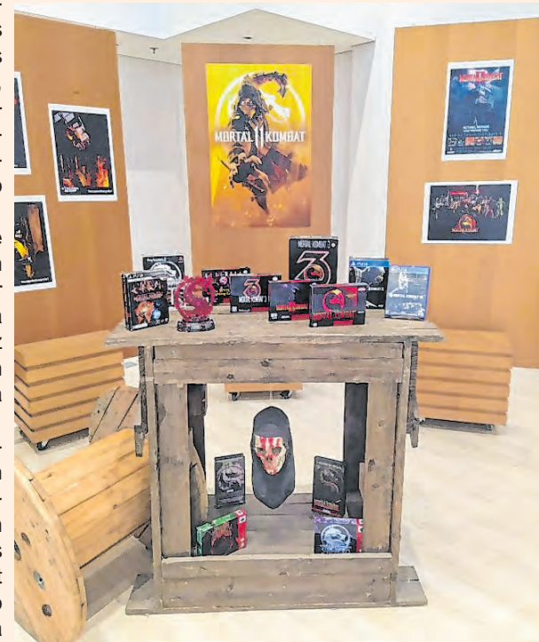
Franquia lançada em outubro de 1992 tem legião de fãs