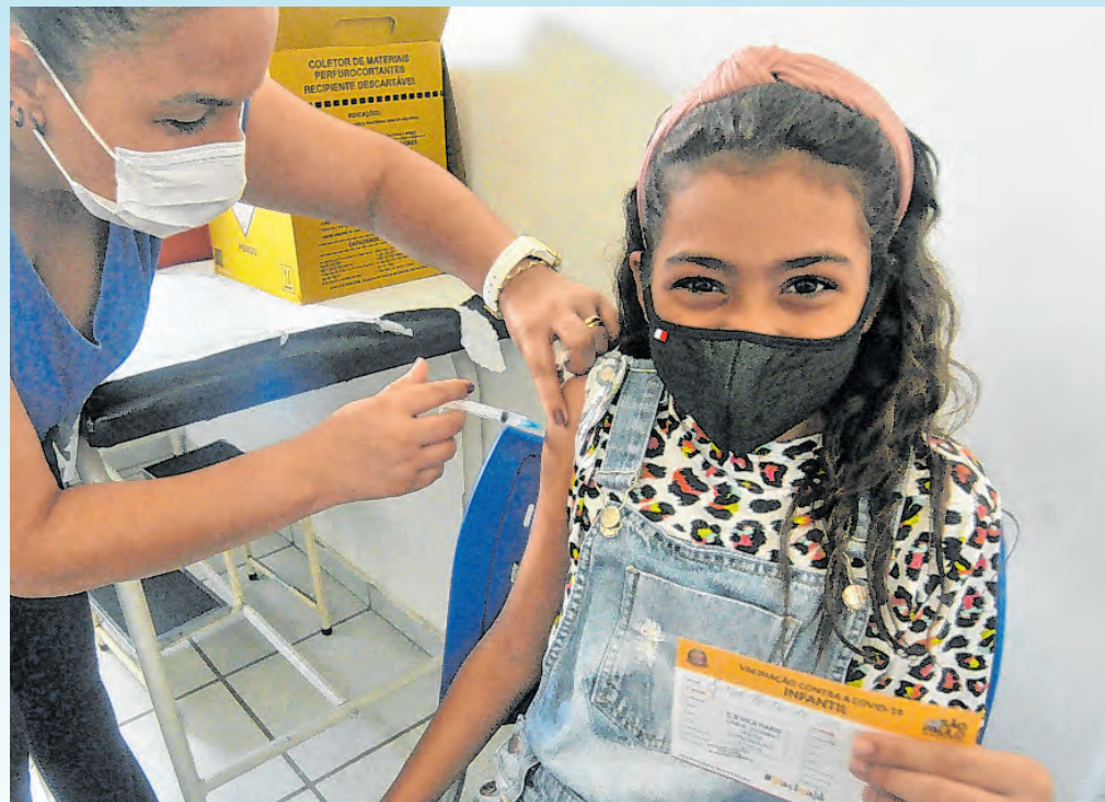
Imunização contra poliomielite segue nas UBSs

Em caso de dúvidas, entre em contato com a Secretaria da Saúde (15) 3238-2430 e (15) 3238-2332, de segunda a sexta, das 8h às 17h.