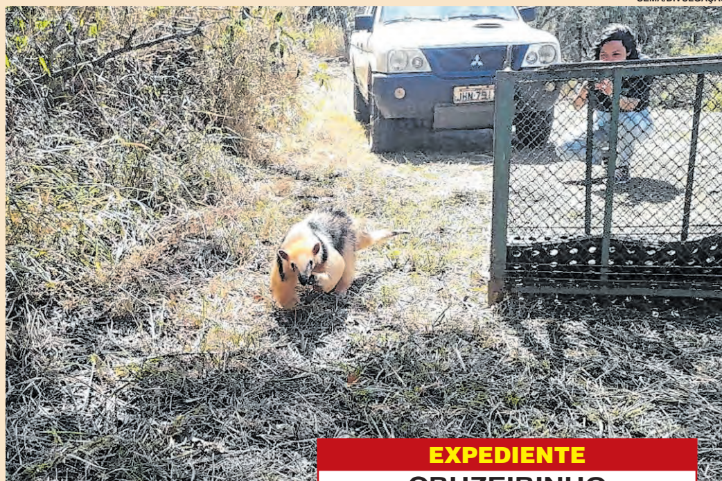
Antes de voltar para o habitat natural os animais silvestres receberam os cuidados necessários

Em 2022, até o dia 6 de setembro, mais de 150 aves, mamíferos e répteis já foram resgatados, devidamente cuidados e devolvidos à natureza. Todas as solturas são autorizadas pela Secretaria Estadual de Infraestrutura e Meio Ambiente (Sima), órgão responsável pela gestão da fauna silvestre no Estado.