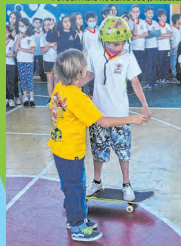
...aprendizado requer paciência e disposição para aprender