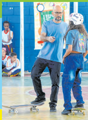
Para educador, a modalidade ajuda a desenvolver o equilíbrio e autoconfiança...

O skate surgiu nos anos 60 lá nos Estados Unidos nas ruas, sem necessidade de um local 'especial' para a prática. No