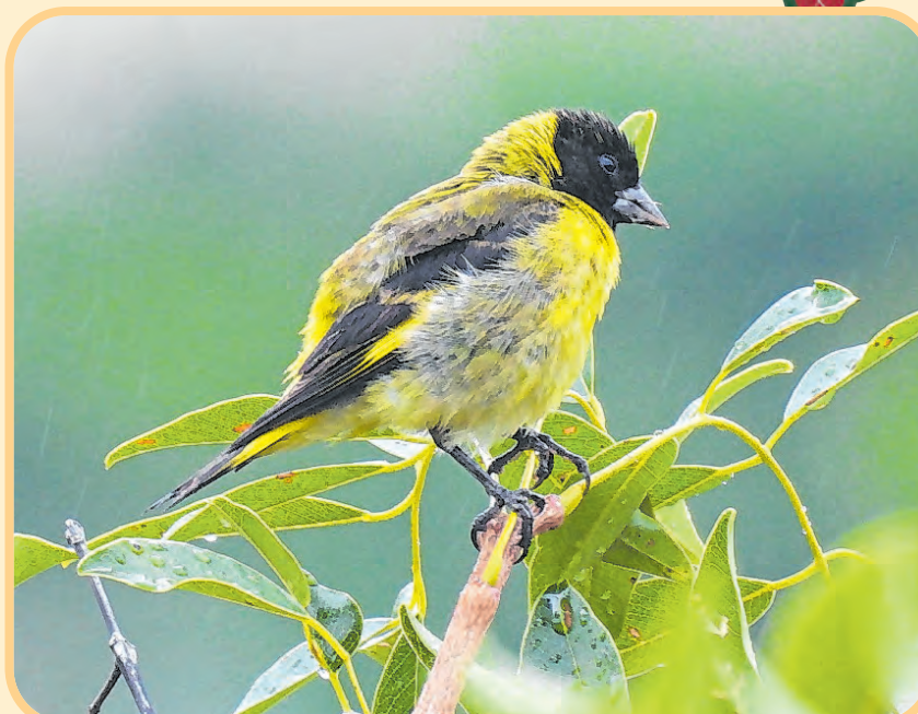
A espécie possui uma máscara negra e manchas amarelas nas asas

Como dissemos, o pintassilgo possui um canto bem bonito. Pa-