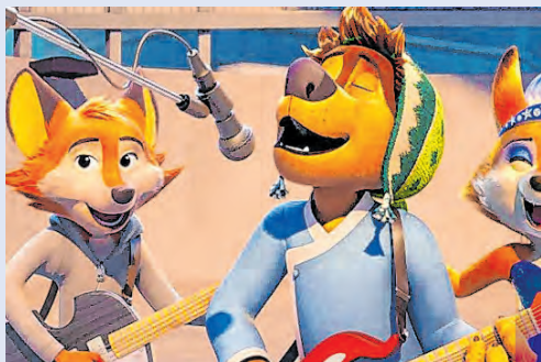
O cãozinho Bodi ama a energia do rock e a música

é ameaçada por máquinas mortíferas, os dois são enviados para procurar os Perlimps, que podem ajudar com o fim da missão de acabar com a mata. Com personalidades opostas, eles descobrirão que não é a apenas a floresta que os une. (Thais Marcolino)