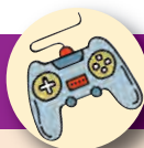
Problemas de coluna na fase adulta podem estar associados ao esforço repetitivo na infância