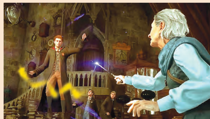
Seu personagem é um estudante que possui a chave para desvendar um segredo que poderia destruir o mundo bruxo