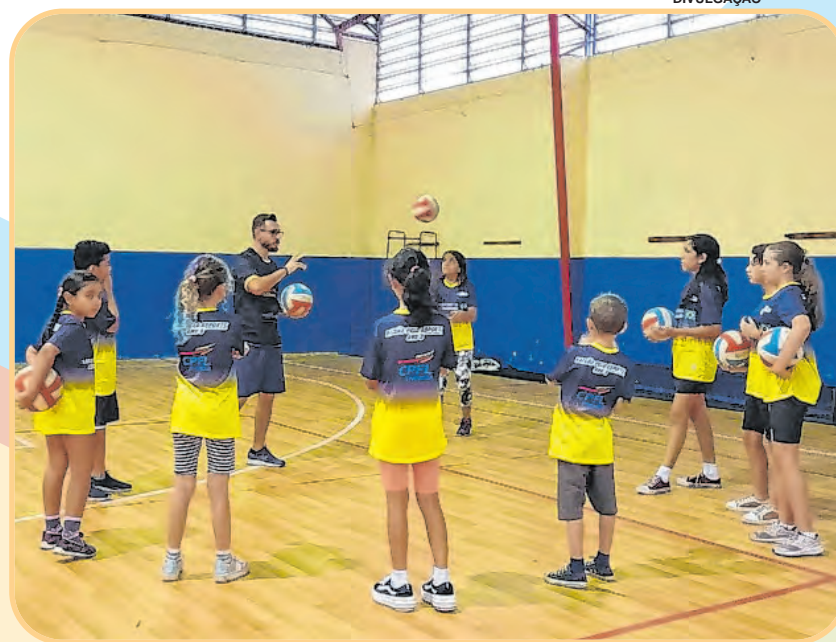
Atividade no CE Jardim Simus é oferecida no contraturno escolar

O centro esportivo está localizado na avenida Américo Figueiredo, nº 1.200, no Jardim Simus. Mais informações podem ser obtidas de segunda a sexta-feira, das 8h às 17h, pelo telefone: (15) 3212-7282 ou pelo e-mail: semes@sorocaba.sp.gov.br. (Da Redação, com Secom Sorocaba)