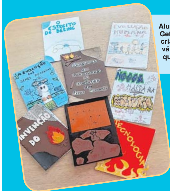
Alunos da EM Getúlio Vargas já criaram vários títulos em quadrinhos