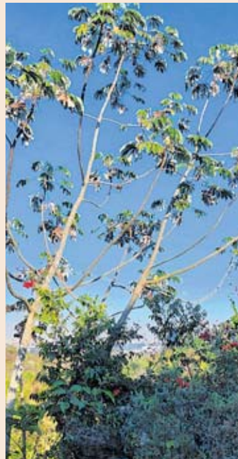
Uma das embaúbas existentes no Jardim Botânico de Sorocaba