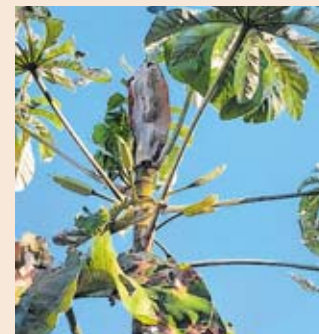
Os frutos da embaúba são doces e apreciados por muitos animais