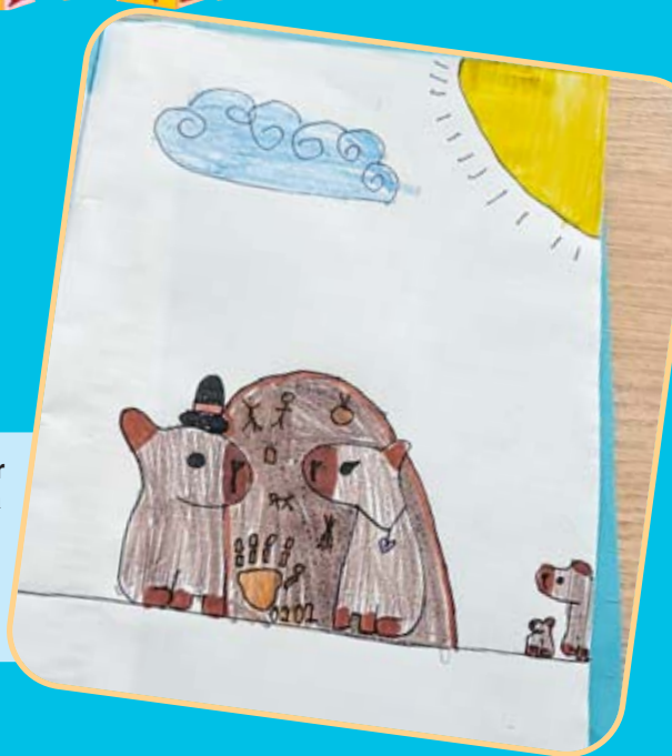
HQ produzida por alunos de Sorocaba aborda o universo desse roedor tão conhecido e querido por nós