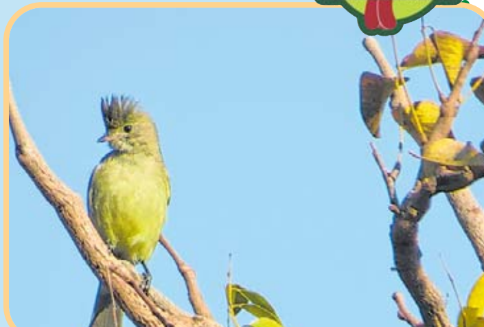
A guaracava também pode ser chamada de maria-é-dia ou maria-acorda

A guaracava-de-barriga-amarela pode estar sempre por perto se continuarmos a plantar árvo-