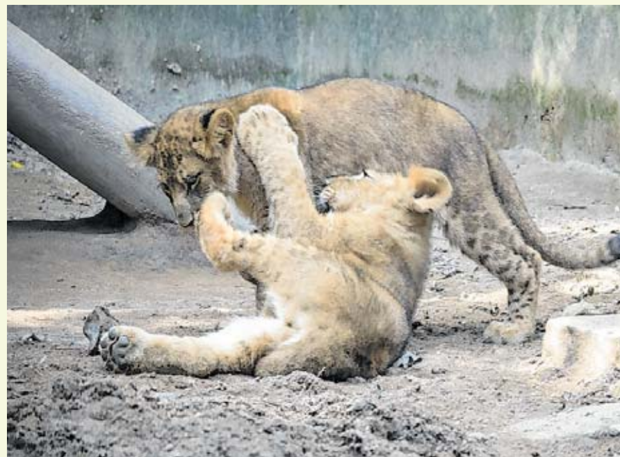
Os leões são filhos do casal Django e Amira