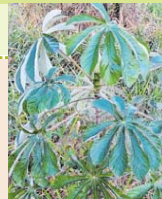
Observe o formato das folhas dessa árvore e repare na coloração