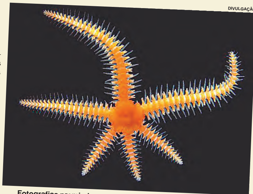
Fotografias premiadas percorrem vários museus do mundo

A exposição ficará montada até dia 14 de outubro, de segunda a sexta-feira, das 9h às 17h, na Biblioteca Municipal de Sorocaba (rua Ministro Coqueijo Costa, nº 180, Alto da Boa Vista). (Da Redação)