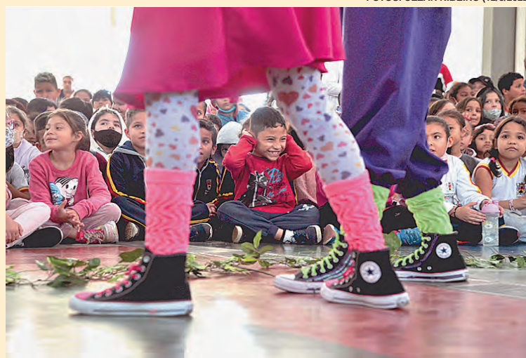
Cerca de mil alunos da E.M. Prof. Renice Seraphim, no bairro Carandá...

A turminha de uma escola de Sorocaba aprendeu de maneira bem divertida como começar essa mudança de atitude. Com muita música, participação dos alunos e situações do cotidiano, aproximadamente mil alunos da E.M. Prof. Renice Seraphim, no bairro Carandá, assistiram à apresentação da peça teatral “Turma da Ação: Missão Natureza” no último dia 12. A peça abordou, por meio de uma verdadeira “missão”, como as crianças também podem ser responsáveis pelo meio ambiente, ajudando e até propondo soluções mais eficientes que os adultos para