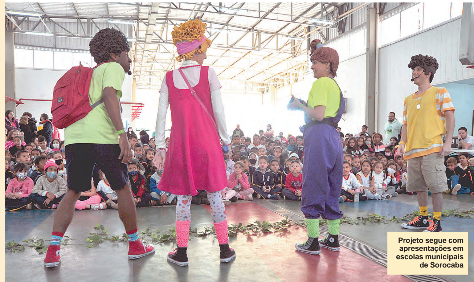
Projeto segue com apresentações em escolas municipais de Sorocaba

Apesar das iniciativas do grupo, o engenheiro demora para mudar de ideia. Então é aí que a galinha da Turma da Ação pensa em usar as redes sociais para