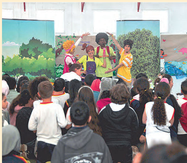
... assistiram encantados a apresentação no início do mês