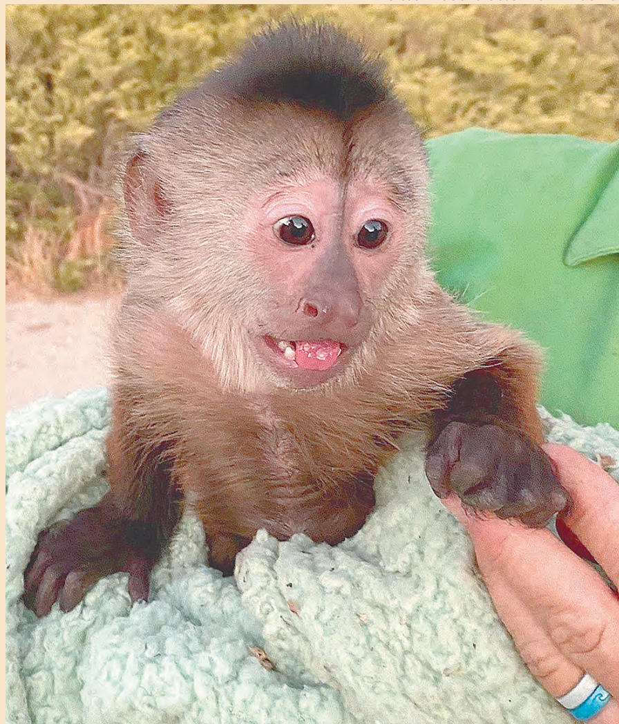
Route é um macaco-prego travesso que mora no Zoo to You, na Califórnia (EUA)