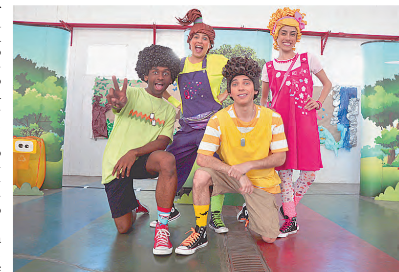
Contato com a arte é outro benefício da atividade às crianças

plantar essa semente. São eles que vão ser o nosso futuro.”, finaliza Gabriel. (T.M.)