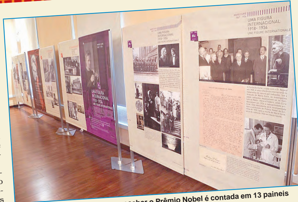
Vida da primeira mulher a receber o Prêmio Nobel é contada em 13 painéis

Desenvolvida pelo Instituto Curie de Paris, a exposição tem como objetivo levar ao conhecimento público os feitos da cientista, que foi a primeira mulher a receber o Prêmio Nobel e único cientista a ser condecorado duas vezes com o prêmio: um de Física (1903), pelas suas descobertas no campo da radioatividade, e