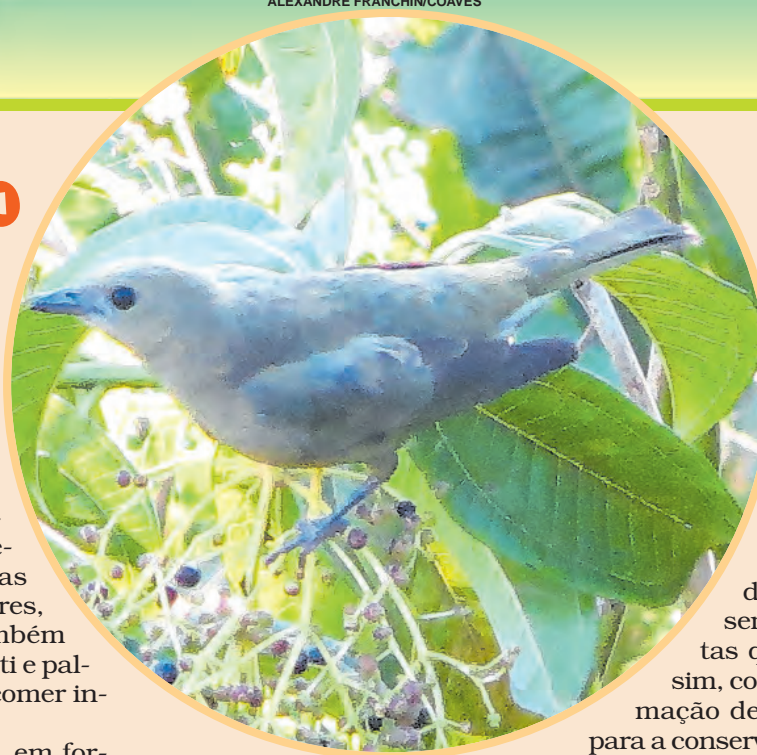
Esse pássaro verde gosta muito de ficar nas palmeiras

Constrói seu ninho, em formato de taça, escondido na folhagem ou nas bainhas das folhas das palmeiras, utilizando folhas secas e fibras vegetais, o que é feito pelo casal. A fêmea põe dois ovos brancos ou cremes com manchas escuras, que le-