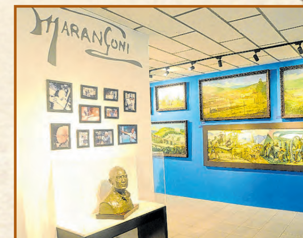
Artista foi testemunha ocular da evolução da cidade

Testemunha ocular da história de Votoran-