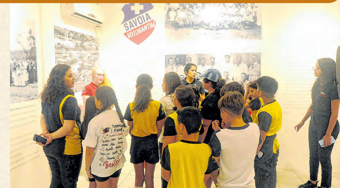
Um dos espaços é dedicado ao Sport Club Savoia, pioneiro do futebol e fundado em 1900

A visita ao Museu Histórico de Votorantim Ettore Marangoni é gratuita. Os horários são esses: de terça a sexta-feira, das 9h às 16h e sábado, das 9h às 13h. Para outras informações, basta ligar para o número (15) 3243-5814. O Museu fica na avenida São João, 649, no Jardim Icatu.