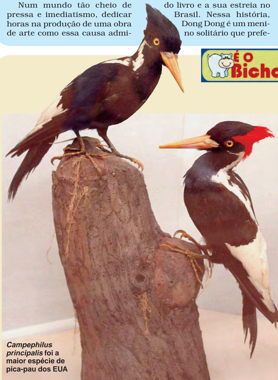
Campephilus principalis foi a maior espécie de pica-pau dos EUA

a melhorar nossos resultados, incluindo documentação por meio de DNA e outras evidências físicas. (...) Nossas descobertas começam a contar uma história maior, não apenas se o pica-pau-de-bico-de-marfim persiste na Louisiana, mas como sobreviveu e por que sua sobrevivência tem sido tão difícil de documentar. Nossas descobertas, e as inferências delas extraídas, sugerem um futuro cada vez mais esperançoso para o pica-pau-bico-de-marfim”, conclui o relatório, liderado pelo pesquisador Steven C. Latta. (Eric Mantuan)