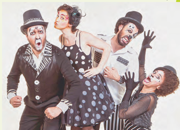
Banda Estralo apresenta “Saltimbancos”, hoje, às 16h

Já no domingo (31), às 16h, a Cia. De Feitos encena a peça de teatro “Inimigos”, com direção e dramaturgia de Carlos Canhamero. Em algum lugar que poderia ser uma cidade, uma floresta ou um deserto, há dois buracos. Neles, dois soldados. Eles são inimigos. A guerra os colocou em lados opostos. E assim brincam de inimigos, conforme ensinou o manual (que diz tudo sobre o inimigo). Os inimigos são exatamente iguais. Quase sempre assustados, com saudades das famílias, todos nervosos, com frio, calor e fome. Se por acaso um dia