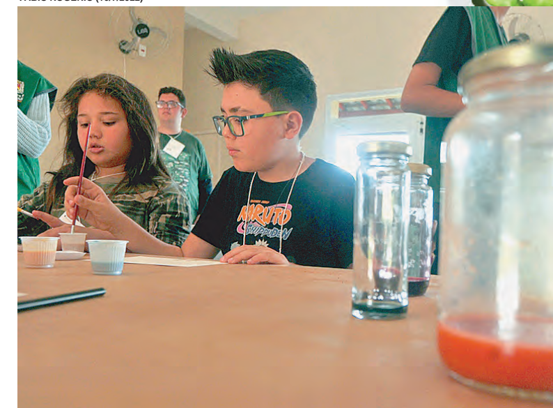
Os pigmentos podem ser usados em desenhos