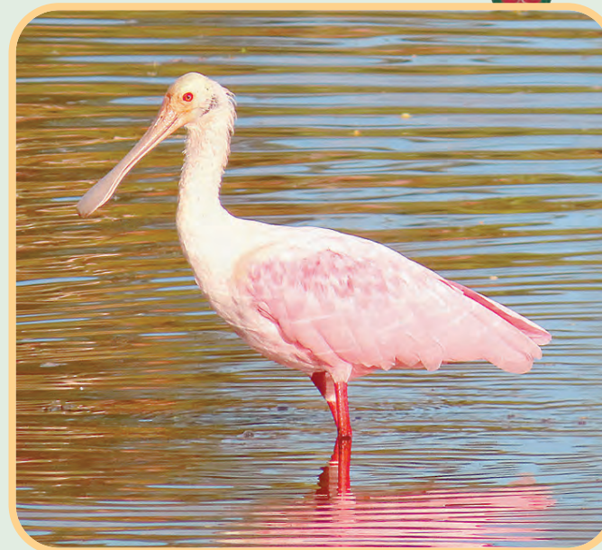
Seu nome está relacionado ao fato do bico ter o formato de uma colher

O colhereiro gosta de água com boa qualidade, ou seja, quando o encon-