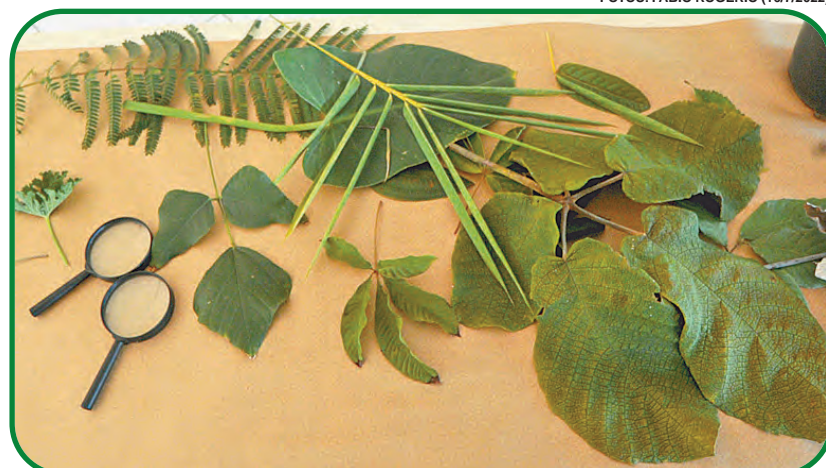
A flora é fundamental para a vida dos seres vivos

E olha só. De acordo com Camila, a natureza também é essencial para a saúde. Durante algum tempo, todos tiveram de ficar dentro de casa, por conta da pandemia de Covid-