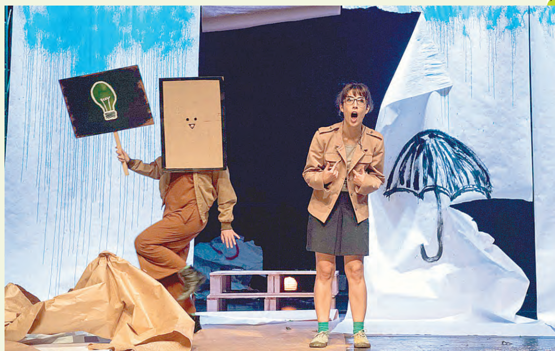
Peça de teatro “Inimigos” será encenada no próximo domingo