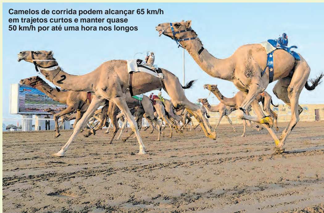
PABLO PORCIUNCULA / AFP (19/11/2022)

Camelos de corrida podem alcançar 65 km/h em trajetos curtos e manter quase 50 km/h por até uma hora nos longos