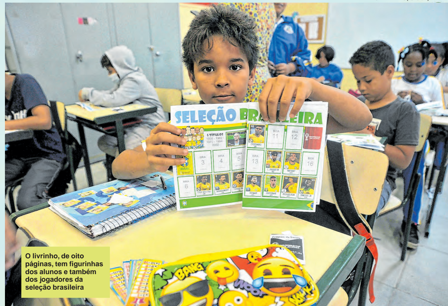
O livrinho, de oito páginas, tem figurinhas dos alunos e também dos jogadores da seleção brasileira