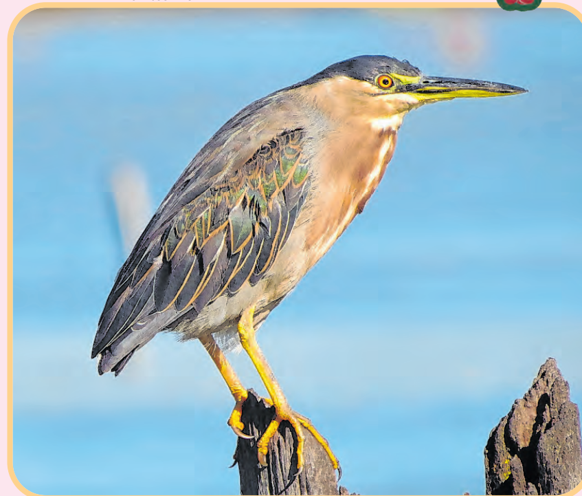
Esta ave aquática vive na beira do Rio Sorocaba e das lagoas do nosso município

depende deles para sua sobrevivência. Por isso, para fazermos nossa parte para conservar essa espécie, devemos preservar os corpos d'água, man-