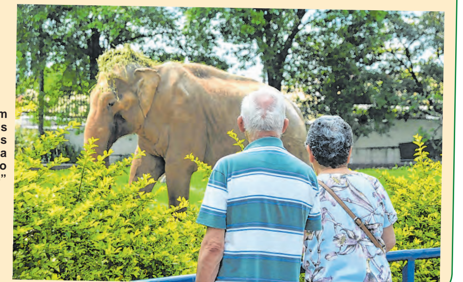
Elefante é um dos animais que mais chama a atenção no “Quinzinho”

Ficou interessado em conhecer o zoo? Ele funciona de terça a domingo, inclusive aos feriados, das 9h às 17h. A bilheteria funciona até as 16h e o ingresso custa entre R$4 e R$8. Crianças até 5 anos não pagam. O endereço é rua Teodoro Kaisel, nº 883, na Vila Hortência. (T. M.)