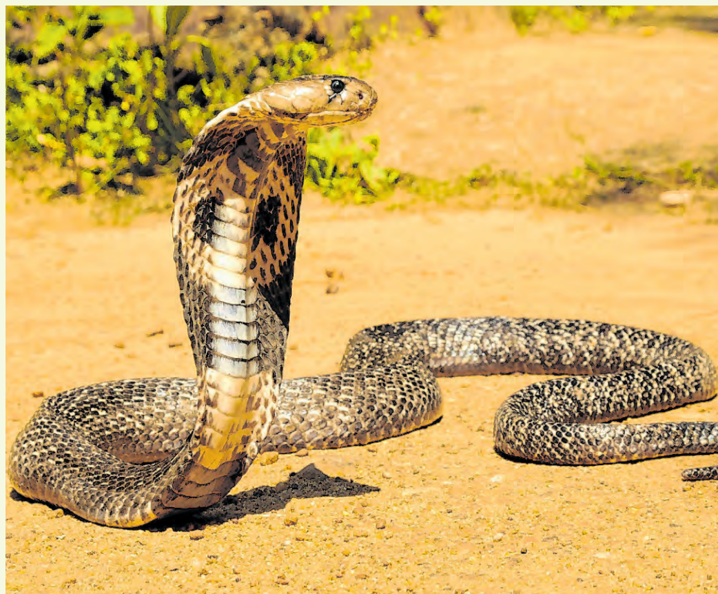
A cobra-real é nativa da Ásia, onde habita planícies e florestas tropicais