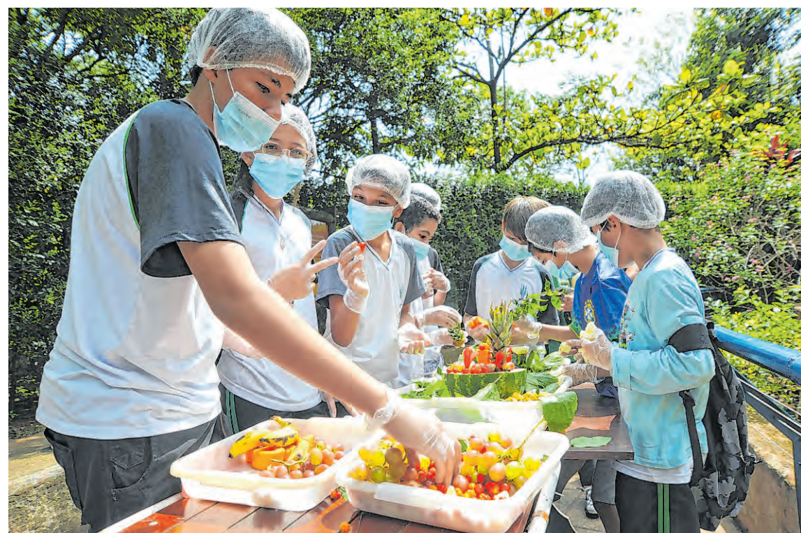
Alunos da E.E. Professora Escolástica Rosa de Almeida ajudaram na “festa” para os bichos