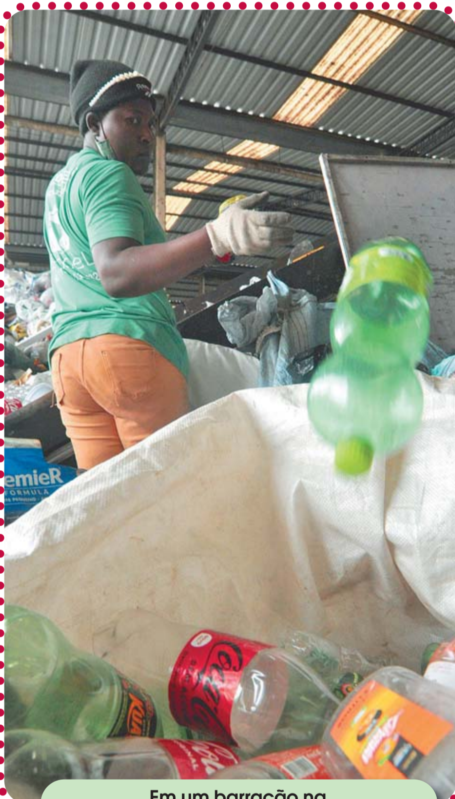
Em um barracão na Vila Colorau, cooperadas fazem a separação dos itens