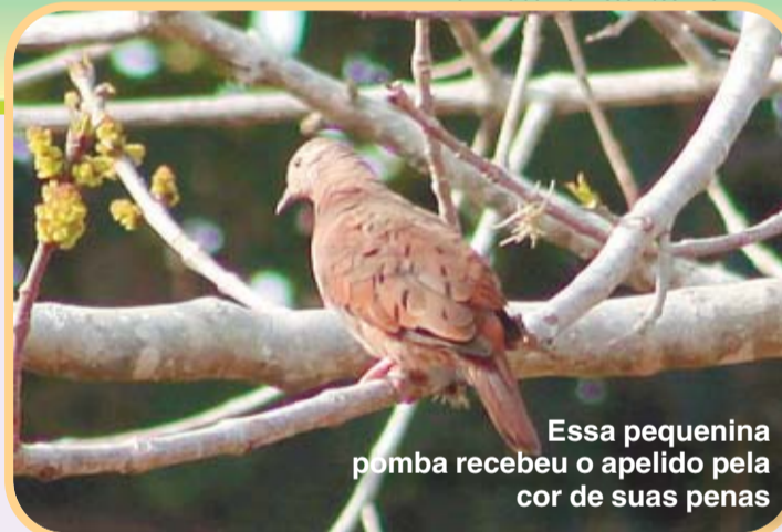
Essa pequenina pomba recebeu o apelido pela cor de suas penas

Ela pode se alimentar de diversos grãos encontrados no chão ou