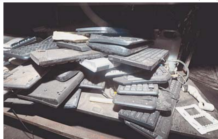
Você sabia que é possível reciclar equipamentos eletrônicos?