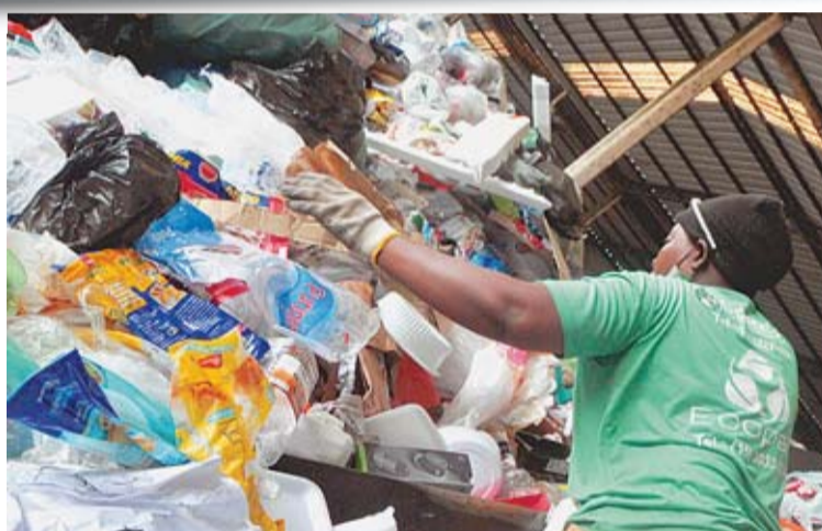
Coreso coleta cerca de 120 toneladas de lixo reciclável todo mês

Coleta seletiva é uma das formas de praticar hábitos ecológicos e ajudar a conservar o planeta