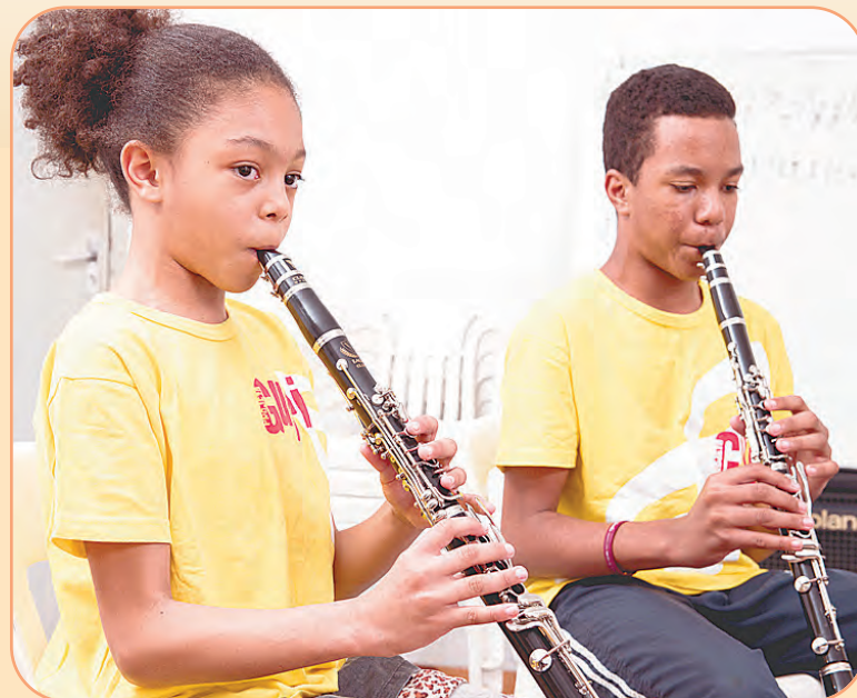
As idades das turmas vão de 6 a 17 anos e 11 meses

O endereço é a avenida São João, nº 649, Jardim Icatu. Horário de atendimento: segundas e quartas das 13h30 às 17h30. O atendimento é por ordem de chegada. As vagas são limitadas! Para mais informações: https://bit.ly/3a8YxFC . (Da Redação)