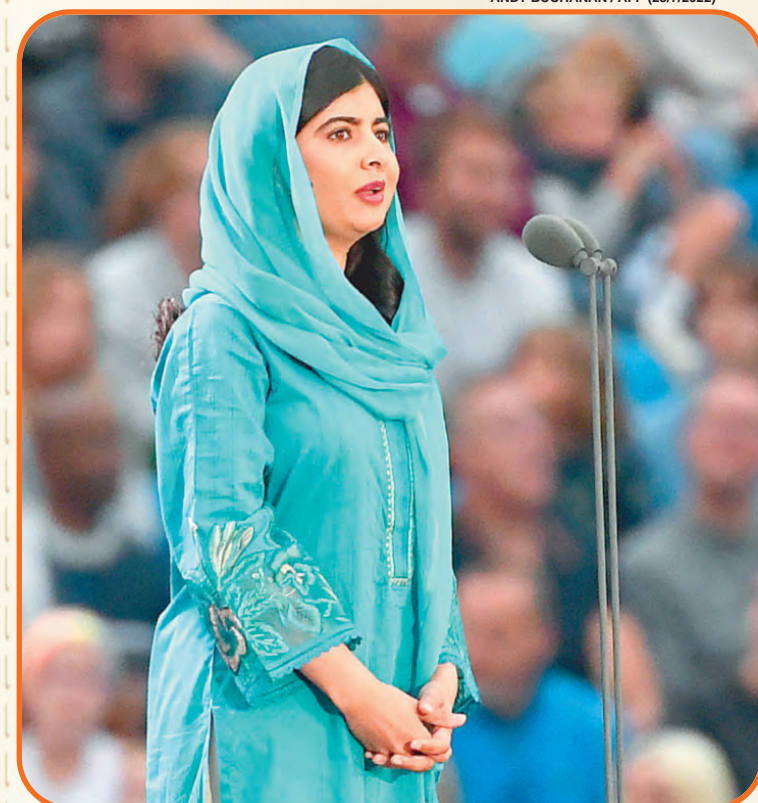
A ativista hoje tem 25 anos e vive na Inglaterra