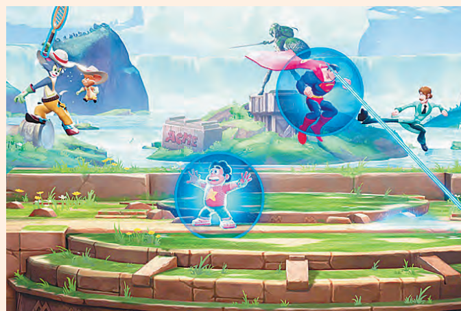
Escolha entre Arlequina, Tom e Jerry, Finn, Mulher-Maravilha, Jake e Superman, entre outros

MultiVersus está disponível gratuitamente em multiversus.com/pt-br/game para PlayStation 5, PlayStation 4, Xbox Series XS, Xbox One, PC e inclui progressão multi-plataforma completo. (Da Redação)