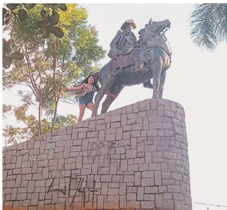
Belinha e a estátua do tropeiro na avenida São Paulo

Uma curiosidade é que a estátua do tropeiro no cavalo que está na Praça do Tropeiro, na avenida São Paulo, não é do Baltazar Fernandes, como muita gente pensa. O fundador de Sorocaba não foi tropeiro, mas sim um Bandeirante. (Da Redação)