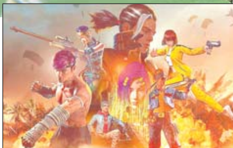
Competição contará com as modalidades Free Fire, Fifa, Rainbow Six e Just Dance

de maio. Já, as etapas eliminatórias presenciais começam nos dias 14 a 15, em Sorocaba, e seguem até o dia 12 de junho, percorrendo as regiões Sul, Norte e Leste do Estado. Por fim, a final presencial acontecerá no Ginásio do Ibirapuera, na capital paulista, no dia 26 de junho.