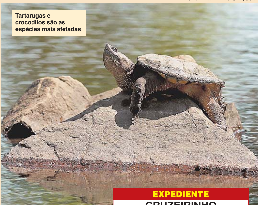
Tartarugas e crocodilos são as espécies mais afetadas

As tartarugas e os crocodilos são as espécies mais afetadas, vítimas da superexploração e a caça. Outro