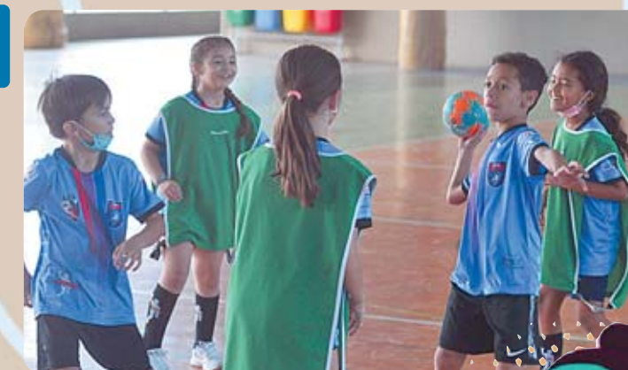
Handebol é um esporte coletivo de origem alemã

Em 1925 a primeira partida internacional de handebol foi realizada. Já no ano de 1934, foi considerado como esporte olímpico pelo Comitê Olímpico Internacional (COI). Mas foi em 1936, nas Olimpí-