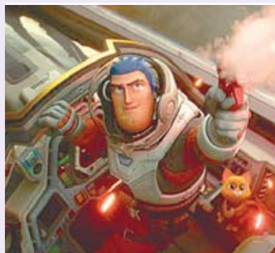
Nova aventura da Pixar conta a origem do herói que inspirou o brinquedo em Toy Story

A aventura de ação de ficção científica "Lightyear" conta a história de origem de Buzz Lightyear, o herói que inspirou o brinquedo em Toy Story (1995). Lightyear segue o lendário patrulheiro espacial depois que em um teste de voo da nave espacial faz com que ele vá para um planeta hostil e fique abandonado a 4,2 milhões de anos-luz da Terra ao lado de seu comandante e sua tripulação. Enquanto Buzz tenta encontrar um caminho de volta para casa através do espaço e do tempo, ele descobre que já se passaram muitos anos desde seu teste de voo e encontra os descendentes de seus amigos, um grupo de recrutas ambiciosos, e seu charmoso gato companheiro robô, Sox. Para complicar as coisas e ameaçar a mis-