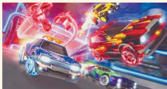
Personalize seu carro e entre em campo, sozinho ou com amigos

Existem versões do jogo também para as plataformas PlayStation 4, Nintendo Switch, Xbox One, Mac OS e Linux. (Da Redação)