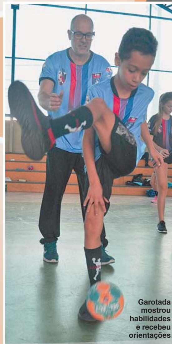
Garotada mostrou habilidades e recebeu orientações

As inscrições para treinar a modalidade de forma gratuita devem ser feitas pelo número (15) 99109-1395. Empresas que se interessarem em apoiar o projeto também podem entrar em contato para parcerias. (Colaborou Inaí Mendonça — programa de estágio)